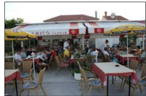
Restaurant Amico (Ilovik)

einem super Restaurant gleich im Hafen. Hier haben wir nach ein paar leckeren Vorspeisen aus dem Meer den besten Steinbutt „ever“ gegessen. Aus dem Ofen, mit Kartoffeln und Gemüse. Also – wenn ihr irgendwann dorthin kommen sollt – Restaurant Amico , Ilovik.