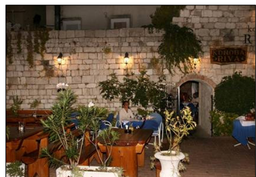
Restaurant Konoba Riva (Rab)

Ankunft auf der Insel Rab , Übernahme des Motorbootes. Hungrig nach dem „Schiff klarmachen“ sind wir noch im Hafen in die sehr einladend aussehende Konoba Riva gegangen. Es war schon sehr spät am Abend aber die Begrüßung wie in Österreich um 19.00 Uhr. Frische Calamari aus der Adria vom Rost mit Mangold. Sensationell. So einen Beginn kann man sich nur wünschen.