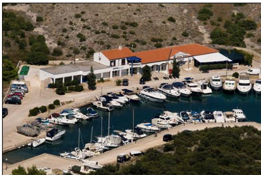
Marina samt Restaurant in Simuni

Plan Nr. 1: weiter „runter“ nach Zadar. Plan Nr. 2: „rüber“ nach Losinj.