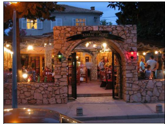
Restaurant Konoba Starac i More (Novalja/Pag)

Frische Meeresfrüchte – schon zu Mittag bestellt – und schwarzes Risotto. Hervorragend.