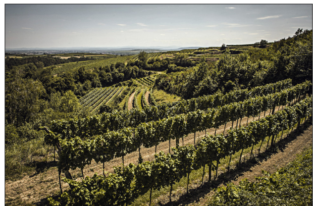
Weintaufe in der Katastralgemeinde Reith in Österreichs größter Weinstadt Langenlois

Abwechslung und Genuss sind jedenfalls garantiert. Zur Begrüßung im stimmungsvollen Festzelt wird ein Glas Winzersekt kredenzt. Die Weinsegnung zelebriert Stadtpfarrer Mag. Jacek